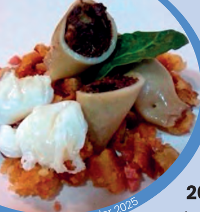
Pincho ganador 2025

Recoge tu papeleta en uno de los establecimientos anteriores y participa en el sorteo de uno de estos premios en vales de 20€ para gastar en los establecimientos participantes antes de 30 días.